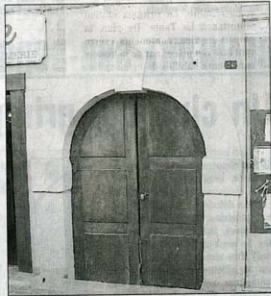
Dans la Grand Rue, une porte témoigne