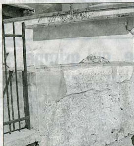
Derrière l'hôtel des télécommunications, une pierre

Lundi prochain, la visite reprendra, en rive gauche, à la découverte du quartier Sainte-Marie. Le rendez-vous, pour cette visite gratuite, est fixé devant l'Office de tourisme